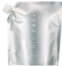
トエルエフェクトブリーチ 500g [医薬部外品]

*使用上の注意をよく読んで、正しくお使いください。*ご使用の際は毎回必ず皮膚アレルギー試験(パッチテスト)を行ってください。