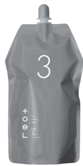
トエルオキシ3% 2剤/NET.1000mL [医薬部外品]