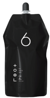
トエルオキシ6% 2剤/NET.1000mL [医薬部外品]