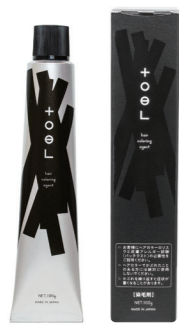
トエルカラー-G 1剤/NET.100g/全32色 [医薬部外品]